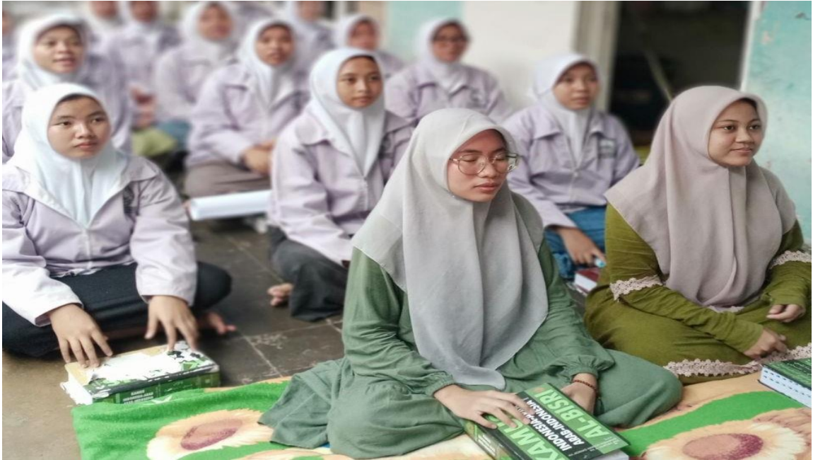
Gambar 2. Pendampingan kegiatan di Lembaga Pengembangan Bahasa Asing

Selain itu, pendampingan juga melibatkan penguatan aspek motivasi dan dukungan emosional. Banyak siswi yang mengalami rasa cemas atau takut salah saat berbicara dalam bahasa asing, yang bisa menghambat proses pembelajaran mereka. Oleh karena itu, penting bagi pendamping untuk menciptakan lingkungan yang aman dan mendukung, di mana siswi merasa nyaman untuk bereksperimen dengan bahasa tersebut tanpa takut dihukum atau diejek. Hal ini dapat meningkatkan rasa percaya diri dan keterlibatan aktif siswi dalam proses belajar (Rifa'i & Sunariya, 2020). pendampingan kepada siswi lembaga pengembangan bahasa asing merupakan elemen kunci dalam pengembangan kompetensi bahasa mereka. Melalui pendekatan yang personal, serta pemberian dukungan psikologis yang tepat, proses pembelajaran dapat berjalan lebih lancar dan efektif. Dengan demikian, pendampingan yang tepat akan membantu siswi dalam menguasai bahasa asing secara lebih baik dan membangun keterampilan yang diperlukan untuk berkomunikasi secara global (Tuan, L. T. & Mai, T. T. 2015).