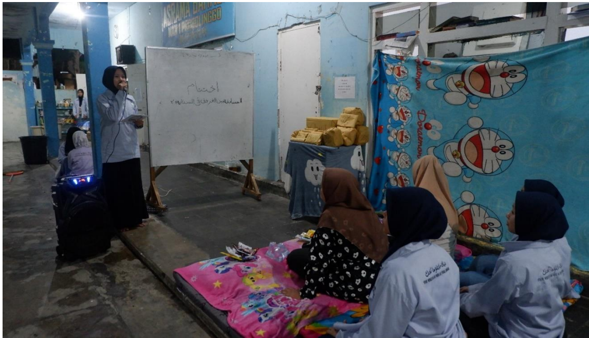
Gambar 4. Penghargaan bagi siswi yang sudah memiliki kompetensi dalam perlombaan antar level.

Aspek kompetensi berbahasa asing yang dikembangkan merujuk pada berbagai keterampilan dan kemampuan yang harus dikuasai oleh seseorang untuk menjadi fasih dan efektif dalam menggunakan bahasa asing. Dalam konteks pembelajaran di Lembaga Pengembangan Bahasa Asing di Pesantren Nurul Jadid, aspek kompetensi berbahasa asing ini mencakup berbagai bidang yang membantu siswi menguasai bahasa asing secara menyeluruh. (Sulaiman, N. 2013) Adapun aspek-aspek yang dimaksud adalah: