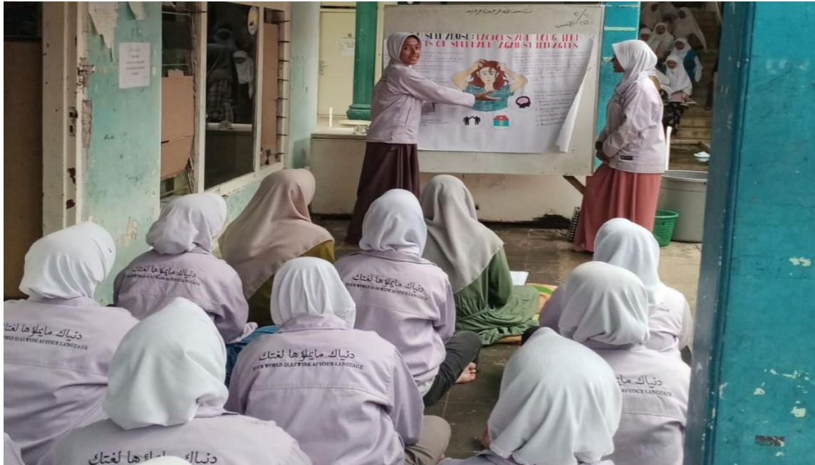
Gambar 3. Pedampingan kegiatan berdiskusi yang dilakukan siswa Lembaga Pengembangan Bahasa Asing untuk melihat kemampuan siswi arab dan inggris.

Dan dengan pendampingan yang dilakukan disetiap kegiatan akan dapat melihat perkembangan kompetensi yang di miliki siswi, selain itu tujuan utama dari pengembangan kompetensi berbahasa asing bagi siswi di Pesantren Nurul Jadid adalah untuk meningkatkan kemampuan berkomunikasi seperti mengajarkan siswi untuk bisa menggunakan bahasa asing dalam konteks percakapan sehari-hari dan situasi formal, baik dalam bahasa Inggris maupun bahasa Arab. Dan meningkatkan pemahaman literasi, memfasilitasi siswi untuk mengakses pengetahuan, jurnal, dan literatur ilmiah yang ditulis dalam bahasa asing (Rifa'i et al., 2022). Hal ini sangat penting dalam konteks perkembangan ilmu pengetahuan. Dan juga dapat memperkuat dasar agama karena Bahasa Arab memiliki peran penting dalam studi agama Islam dan sebagian besar kitab-kitab agama dan ajaran-ajaran Islam ditulis dalam bahasa Arab. Selain itu, bahasa Inggris juga dibutuhkan untuk memahami literatur agama dalam konteks internasional. Juga bisa menyiapkan siswi untuk dunia professional, mengingat pentingnya penguasaan bahasa asing dalam dunia kerja, penguasaan bahasa Inggris dan bahasa Arab akan memberikan siswi keunggulan dalam mencari peluang pekerjaan, baik di lembaga internasional maupun di sektor bisnis global.