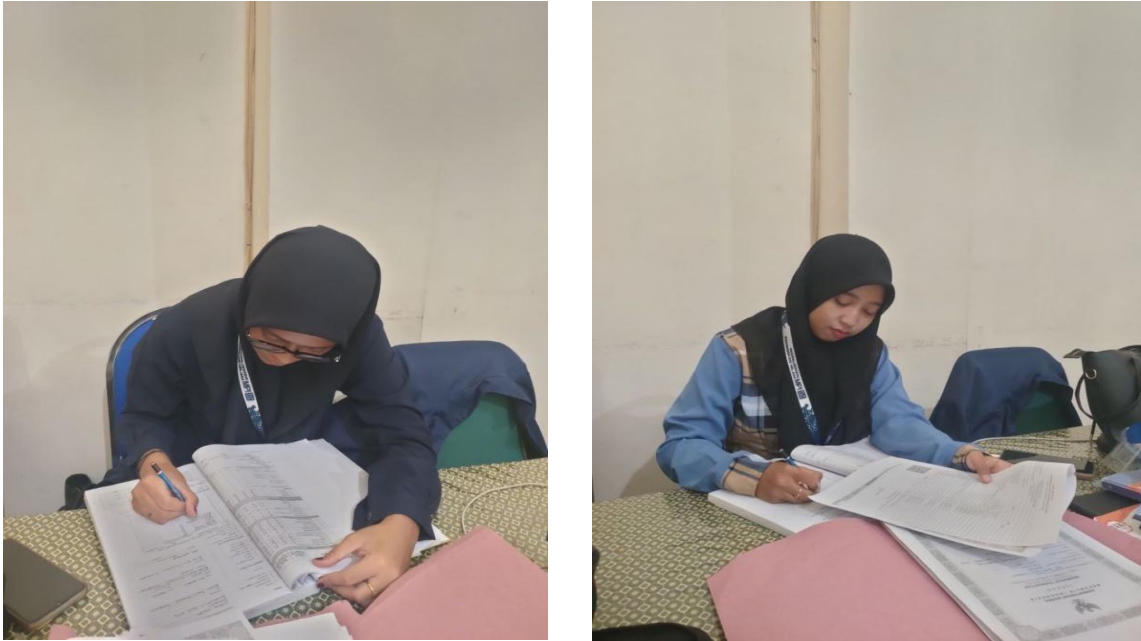
Gambar 03. Sistem Pencatatan yang Tertata dan Pelaporan Keuangan

Rekapitulasi nota pengeluaran merupakan salah satu aspek penting dalam mendukung tertib administrasi dan transparansi keuangan di lingkungan lembaga pendidikan. Proses ini menuntut ketelitian, sistem kerja yang terorganisasi, serta dukungan lingkungan kerja yang nyaman dan efisien. Dalam kerangka Madrasah Aliyah Badriduja Kraksaan Probolinggo, penerapan sistem rekapitulasi nota pengeluaran yang baik mencerminkan komitmen lembaga dalam mewujudkan tata kelola administrasi yang akuntabel, tertib, dan profesional (Pettalongi et al.). Penyusunan rekapitulasi nota pengeluaran yang sistematis sangat penting untuk mengurangi potensi kesalahan pencatatan, meningkatkan efisiensi kerja, serta memudahkan proses verifikasi dan pelaporan keuangan kepada pihak terkait. Dengan adanya sistem pencatatan yang tertata, setiap transaksi keuangan dapat dipertanggungjawabkan secara jelas dan transparan, sekaligus memperkuat kepercayaan terhadap manajemen madrasah (Apriyanti).