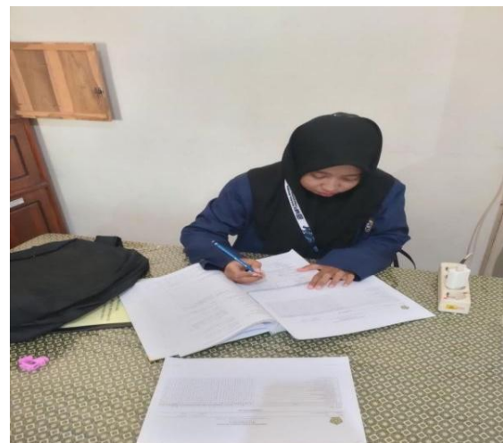
Gambar 02. Sistem Rekapitulasi Nota Pengeluaran yang Efektif