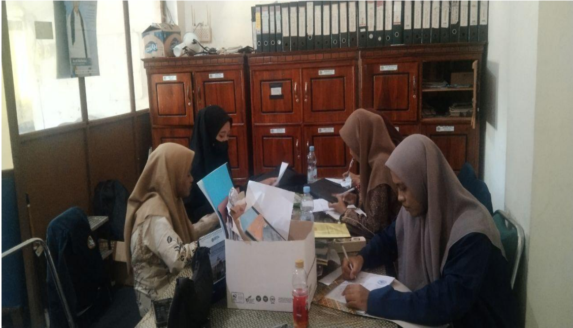
Gambar 05 aspek kebersihan dan kerapian, pengelolaan administrasi dalam rekapitulasi nota pengeluaran

Pengawasan terhadap kebersihan ruang administrasi juga mencakup perawatan udara dan pencahayaan buatan. Cahaya yang cukup akan membantu staf membaca data keuangan dengan lebih teliti, sementara ventilasi yang baik mencegah udara pengap yang dapat menurunkan produktivitas kerja. Petugas kebersihan harus rutin memeriksa kondisi lampu, kipas, dan jendela untuk memastikan lingkungan kerja tetap segar dan bebas debu. Selain itu, perawatan perabotan dan perlengkapan kerja seperti meja arsip, kursi, dan rak dokumen juga harus dilakukan secara berkala (Qarni and Dauly). Pemilihan bahan perabot yang kuat dan mudah dibersihkan menjadi pertimbangan utama untuk menjaga umur pakai dan efisiensi perawatan. Kerapian ruang arsip dan meja kerja mencerminkan profesionalisme lembaga dalam mengelola administrasi keuangan yang transparan dan tertib. Evaluasi rutin pasca kegiatan administrasi perlu dilakukan untuk memastikan semua area kerja dalam kondisi bersih dan siap digunakan kembali. Dengan demikian, pengelolaan kebersihan dan kerapian ruang administrasi tidak hanya menjaga kenyamanan kerja staf, tetapi juga memperkuat citra Madrasah Aliyah Badriduja sebagai lembaga yang tertib dan profesional dalam manajemen keuangan (Septiani).