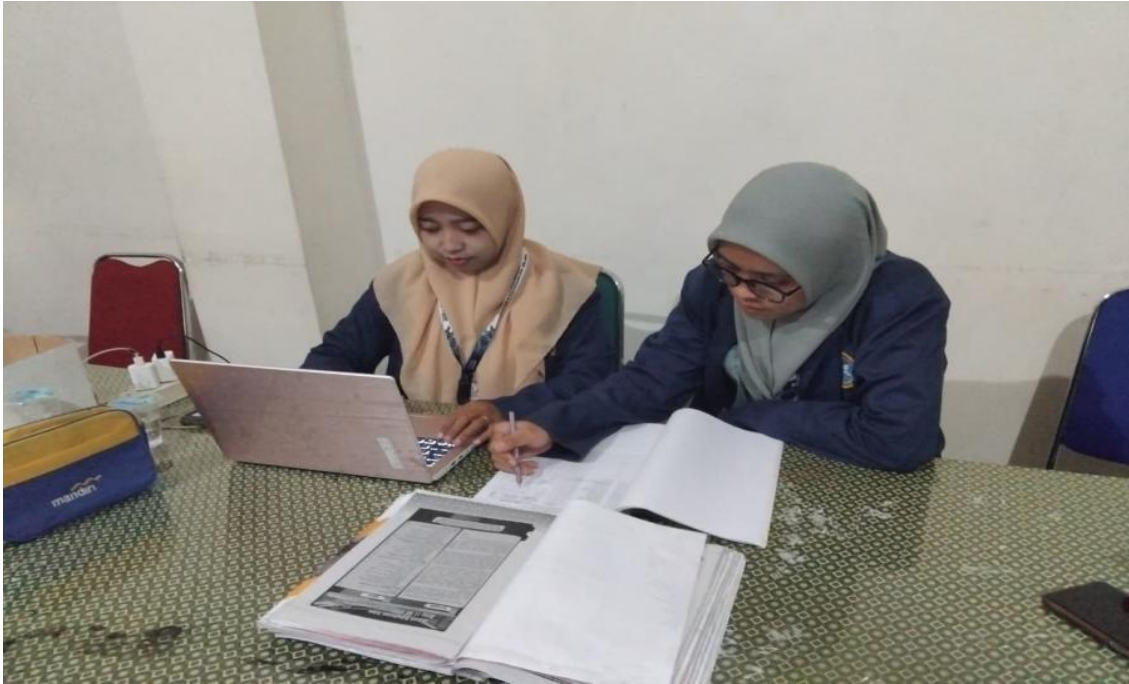
Gambar 04. Aplikasi Administrasi Keuangan serta Penyimpanan Dokumen Digital

bertanggung jawab, dan berorientasi pada peningkatan kualitas layanan pendidikan (Devi et al.).