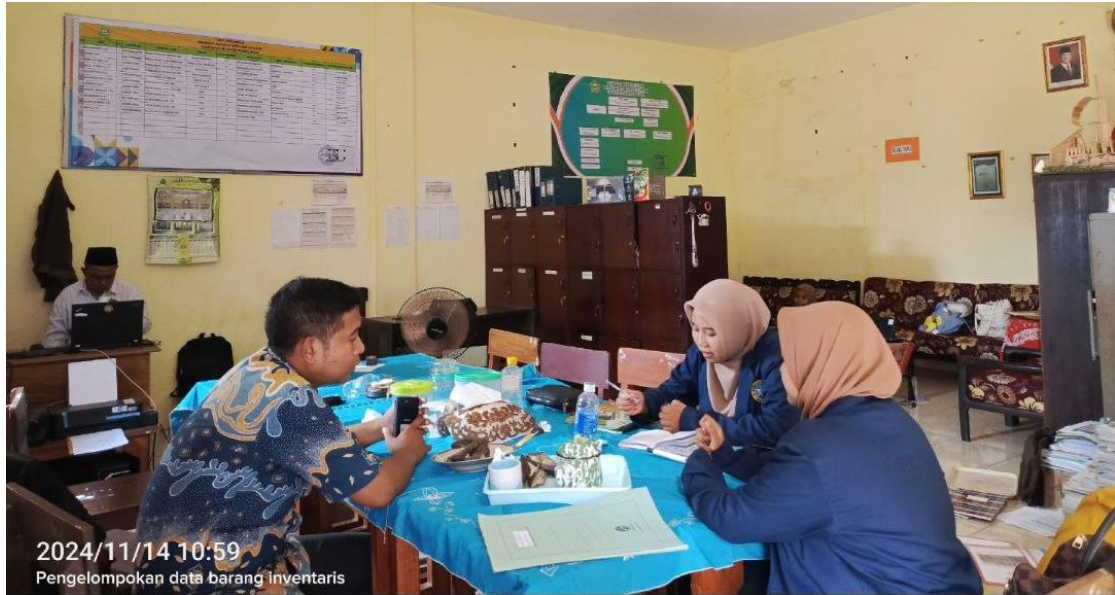
Gambar 2. Pengkategorisasian Sarana dan Prasarana.