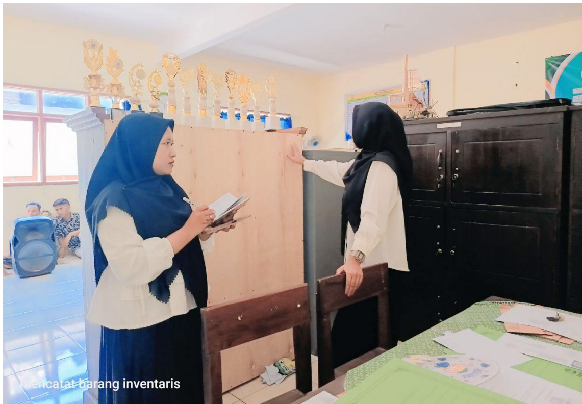
Gambar 1. Pencatatan Nama Sarana dan Prasarana Madrasah.

Kurang memadainya sarana dan prasarana pendidikan dapat berdampak kepada proses pembelajaran dan hal itu juga dapat berdampak kepada kualitas pendidikan. Adanya sarana dan prasarana sangat membantu dalam kegiatan pendidikan. Sarana dan prasarana yang lengkap dan baik memberikan andil besar terhadap kemampuan siswa seperti adanya fasilitas olahraga yang lengkap dapat menjadikan siswa tertarik dan semangat dalam berolahraga hal itu dapat menumbuhkan kemampuan dalam bidang olahraga siswa. (Nurharirah & Effane, 2022)