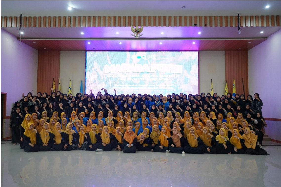
Gambar 4. Pelaksanaan Workshop Pendidikan Dasar Manajemen Pembiayaan Organisasi Santri di Pondok Pesantren Lubbul Labib.

Pelaksanaan workshop dilaksanakan oleh semua pengurus kopri maupun kopri komisariat kepada para mahasiswa di Universitas Nurul Jadid Paiton, probolinggo pada 21-22 Januari 2024, peserta yang hadir adalah semua kader-kader dalam organisasi pergerakan mahasiswa islam indonesia.