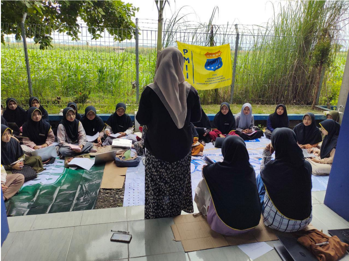
Gambar 3. Penyusunan Materi Pengabdian dan Jadwal Workshop Organisasi Mahasiswa.

Penyusunan materi workshop terdiri atas beberapa materi yaitu materi teori tentang ke-aswajaan, ke-indonesiaan dan beberapa materi yang diberikan guna mencetak pemimpin yang inovatif dan berkarakter. Hal ini sependapat dengan apa yang disampaikan oleh Moh. Rifa'i bahwa perencanaan materi perlu dilakukan dengan pasti dan diputuskan berikut langkah-langkahnya sebelum melakukan tindakan di lapangan (Rifa'i, 2022).