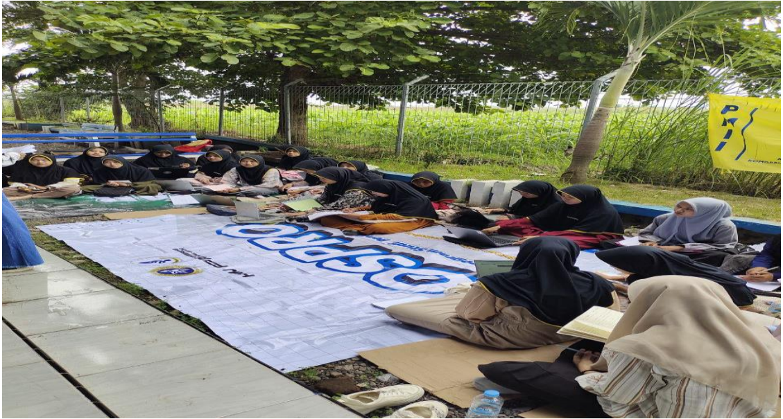
Gambar 1. Survey Lapangan dan Identifikasi Permasalahan.

Langkah tersebut sesuai dengan pendapat Maidiana bahwa dalam menemukan informasi penggunaan survei menjadi hal penting yang mana bertujuan untuk memberikan gambaran tentang sesuatu dan untuk melakukan analisis. Langkah-langkahnya adalah menentukan permasalahan, menyusun hipotesis, menentukan tujuan, menentukan tipe survei yang sesuai, menentukan desain sampel, menentukan besarnya sampel, membuat pertanyaan dan memilih alat tes apa yang akan digunakan, menentukan bentuk pengumpulan data sesuai definisi konseptual alat penelitian, memproses data, melakukan analisis data, dan membahas analisis data dan menyusun laporan (Maidiana, 2021). Adapun pengabdian ini fokus pada kaderisasi dalam organisasi bagi pengurus organisasi yang diharapkan berdampak pada peningkatan mutu layanan bagi para mahasiswa yang terlibat di dalam organisasi PMII Universitas Nurul Jadid Paiton, Probolinggo.