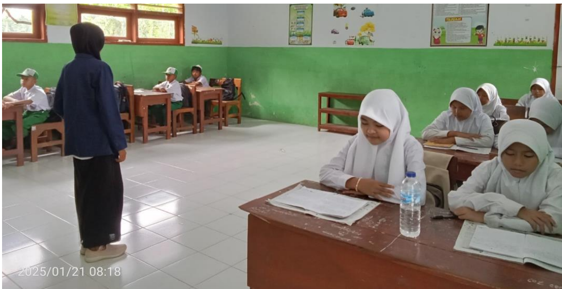
Gambar 2. Tahap Pelaksanaan Perwujudan Perilaku Sopan Siswa di Madrasah Ibtidaiyah Nurul Qodir.

Secara keseluruhan, tahap pelaksanaan mencakup serangkaian kegiatan yang dirancang untuk meningkatkan kesadaran dan praktik sopan santun di kalangan siswa, serta melibatkan guru dan orang tua dalam proses pembelajaran. Dengan melaksanakan kegiatan-kegiatan ini secara efektif, diharapkan perilaku sopan santun dapat menjadi bagian integral dari budaya sekolah.