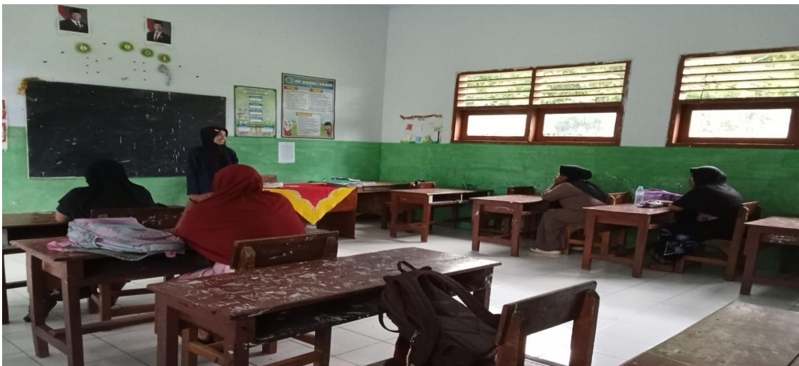
Gambar 3. Musyawarah bersama Wali Murid Madrasah Ibtidaiyah Nurul Qadir.

Secara keseluruhan, tahapan hasil ini menunjukkan bahwa intervensi yang dilakukan berhasil meningkatkan perilaku sopan santun siswa, didukung oleh keterlibatan orang tua dan guru serta data yang valid sebagai bukti. Hal ini menjadi dasar untuk merencanakan langkah-langkah selanjutnya dalam proses pendidikan dan pembentukan karakter siswa.