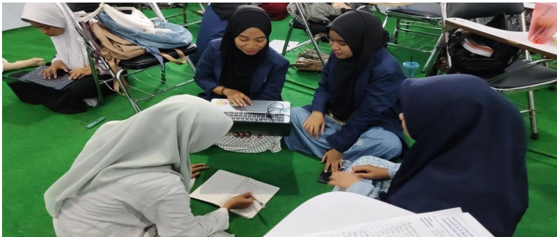
Gambar 1. Tahap Perencanaan Pengabdian oleh Tim

Secara keseluruhan, tahap perencanaan merupakan fondasi penting untuk keberhasilan program pendampingan perilaku sopan santun siswa, karena semua langkah yang diambil dalam tahap ini akan mempengaruhi efektivitas program secara keseluruhan.